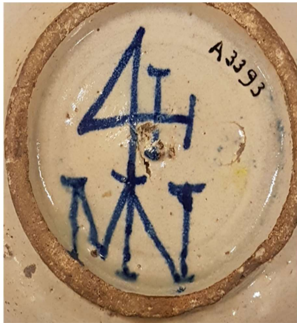
Museum Boijmans-Van Beuningen Rotterdam