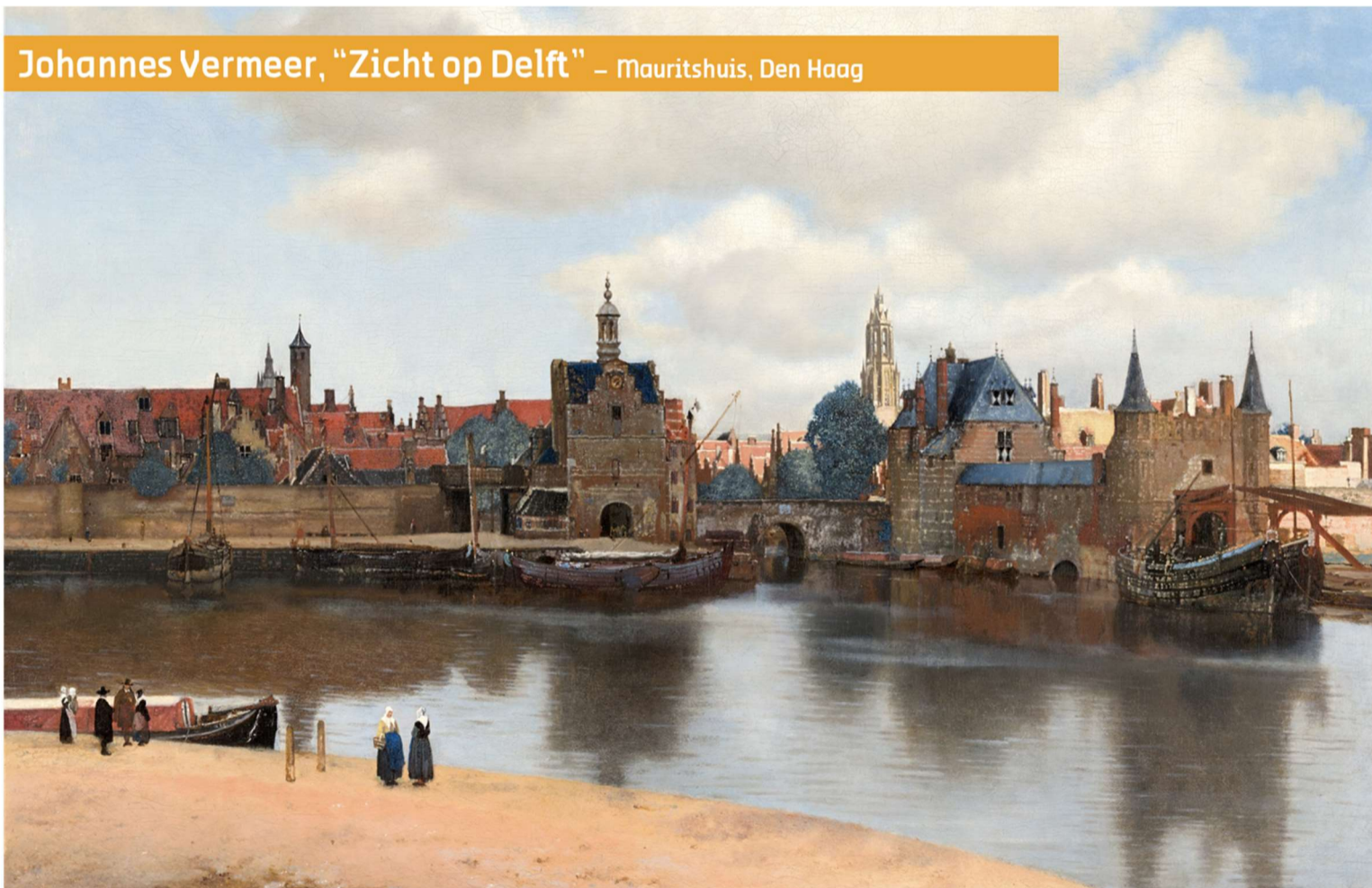
Johannes Vermeer, "Zicht op Delft" – Mauritshuis, Den Haag